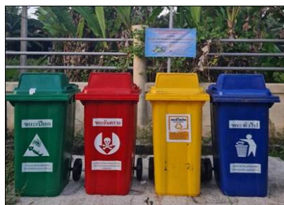
การจัดวางถังขยะภายในพื้นที่กลุ่มบริษัท โดยคัดแยกประเภทขยะก่อนทิ้งตามหลัก 3R