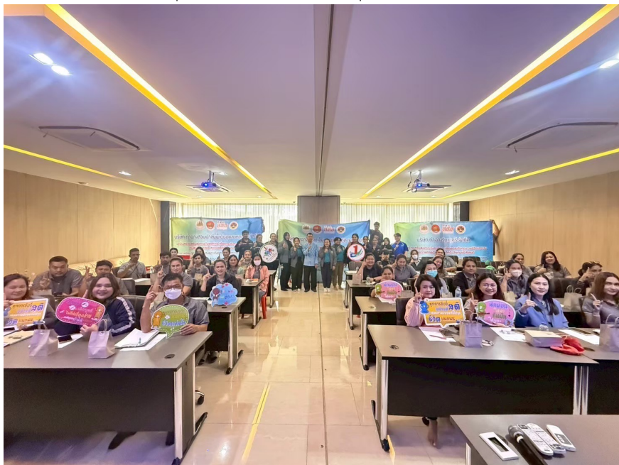
โครงการสร้างสุขวัยทำงาน ปี 2568