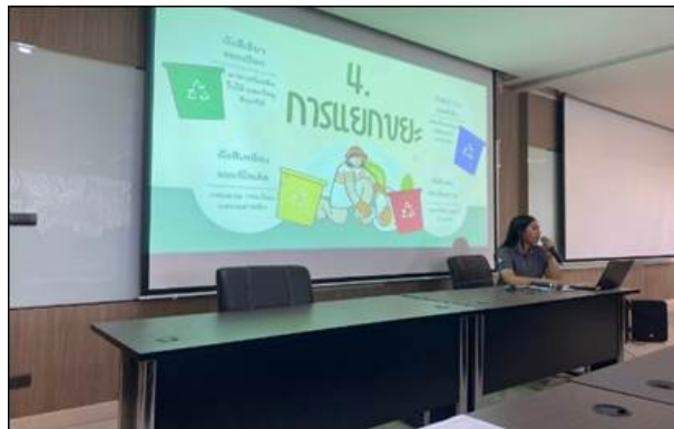
การประชาสัมพันธ์กิจกรรมและจัดอบรมคัดแยกขยะให้กับพนักงานตามหลัก 3R

กลุ่มบริษัทจัดกิจกรรมอบรมเพื่อเสริมสร้างความรู้และจิตสำนึกด้านการจัดการของเสียตามหลัก 3R และการคัดแยกของเสียอย่างถูกต้อง โดยบูรณาการเนื้อหาไว้ในกระบวนการปฐมนิเทศพนักงานใหม่และการอบรมทบทวนสำหรับพนักงานเดิมอย่างต่อเนื่อง ในปี 2568 มีการจัดอบรมจำนวน 4 ครั้ง ครอบคลุมพนักงานร้อยละ 100 ขององค์กร โดยเน้นการลดการเกิดของเสียตั้งแต่ต้นทาง การใช้ทรัพยากรอย่างคุ้มค่า และการคัดแยกของเสียตามประเภทอย่างถูกต้อง ผลการดำเนินงานพบว่าพฤติกรรมคัดแยกของเสียที่ถูกต้องในพื้นที่ปฏิบัติงานเพิ่มขึ้นร้อยละ 80 สะท้อนถึงการเสริมสร้างวัฒนธรรมองค์กรด้านการจัดการของเสียและการมีส่วนร่วมของพนักงานในการดำเนินงานด้านสิ่งแวดล้อม