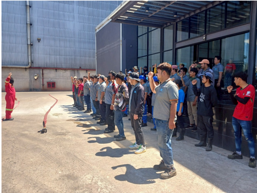
การอบรมดับเพลิงและฝึกซ้อมอัคคีภัย ปี 2568