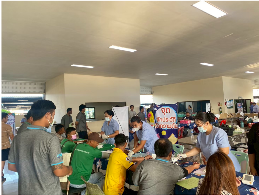
การตรวจสุขภาพให้กับพนักงานของกลุ่มบริษัท ประจำปี 2568